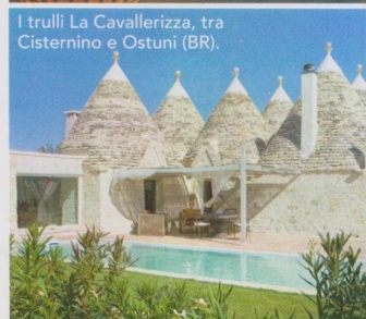
I trulli La Cavallerizza, tra Cisternino e Ostuni (BR).