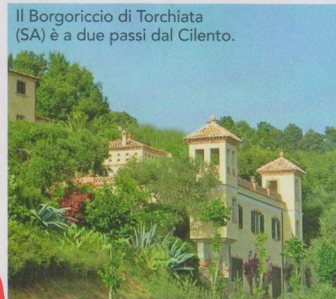
Il Borgoriccio di Torchiara (SA) è a due passi dal Cilento.