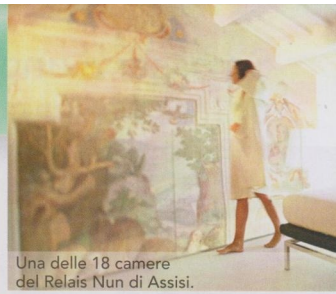
Una delle 18 camere del Relais Nun di Assisi.

Info: San Domenico a Mare, Savallesi (BR), tel. 080/4827769, www.masseriasandomenico.com