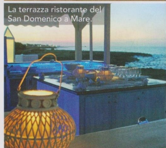
La terrazza ristorante del San Domenico a Mare.